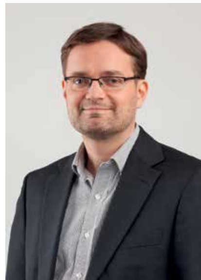
Antoisia lukuhetkiä ja aurinkoisia kesäpäiviä

Tässä lehden teemana on sähköinen liikenne ja se, miten SGS on mukana turvallisen sähköisen liikenteen varmistamisessa.